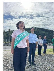
◆志摩市議選の応援にも