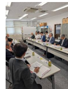
◆三重団体要望懇談会