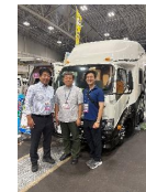
◆キャンピングカーの活用!