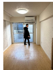
◆12月新事務所スタート!