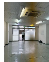
◆10月旧事務所明渡し