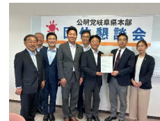
◆岐阜団体要望懇談会