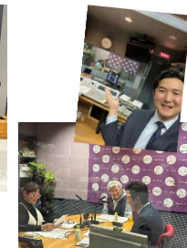
◆東海ラジオでの収録 いつも楽しく元気に