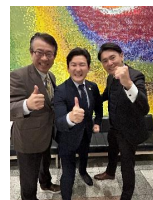
◆名古屋市緑区支部会