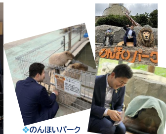
◆のんほいパーク カピバラや オランウータンとも仲良く