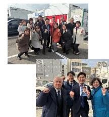
◆総選挙「中道」スタート!