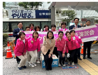
◆ピンクリボン街頭 竹谷とし子参議院議員と